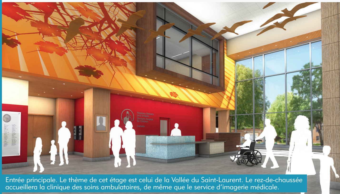
Entrée principale. Le thème de cet étage est celui de la Vallée du Saint-Laurent. Le rez-de-chaussée accueillera la clinique des soins ambulatoires, de même que le service d'imagerie médicale.