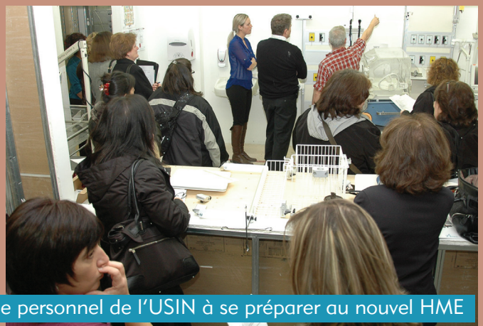
Une reproduction des chambres des patients aidera le personnel de l'USIN à se préparer au nouvel HME