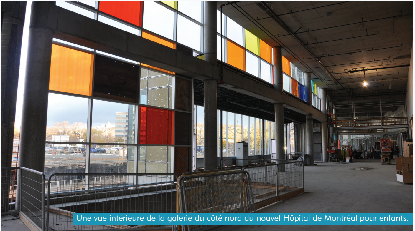
Une vue intérieure de la galerie du côté nord du nouvel Hôpital de Montréal pour enfants.

Maintenant que la brique et le mortier sont en place, pleins feux sur les gens!