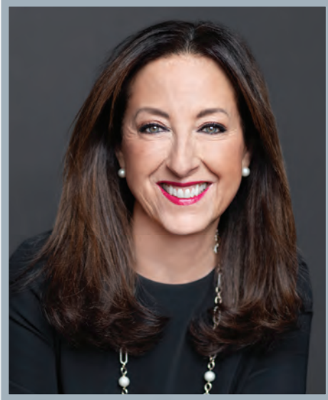
Mise en beauté : Véronique Prud'homme